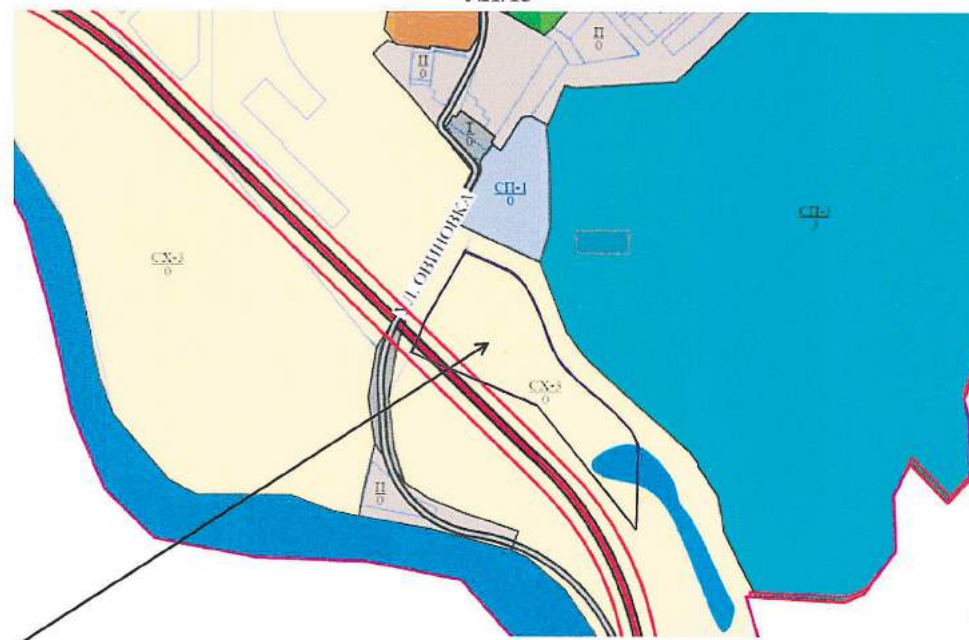
Земельный участок КН 50:64:0020206:117 расположен в зоне сельскохозяйственного производства (СХ-3)