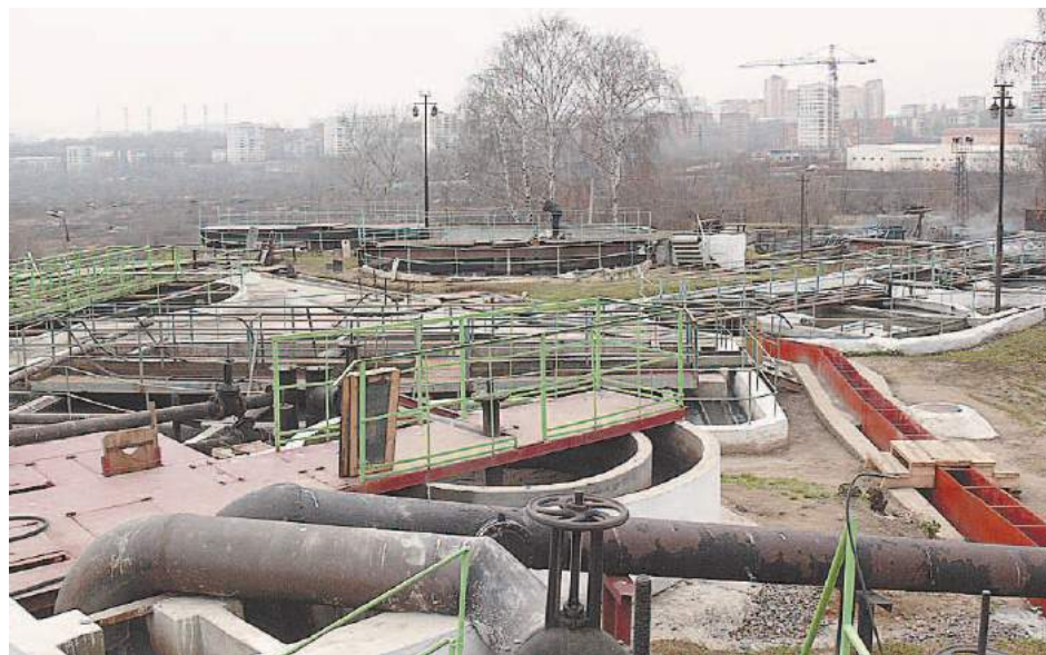
Биологическая очистная станция. 2006 год