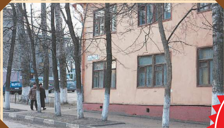
УЛИЦА БОНДАРЕВА, Д. 5