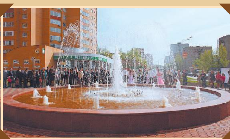
ФОНТАН, УЛИЦА ЛЕСНАЯ