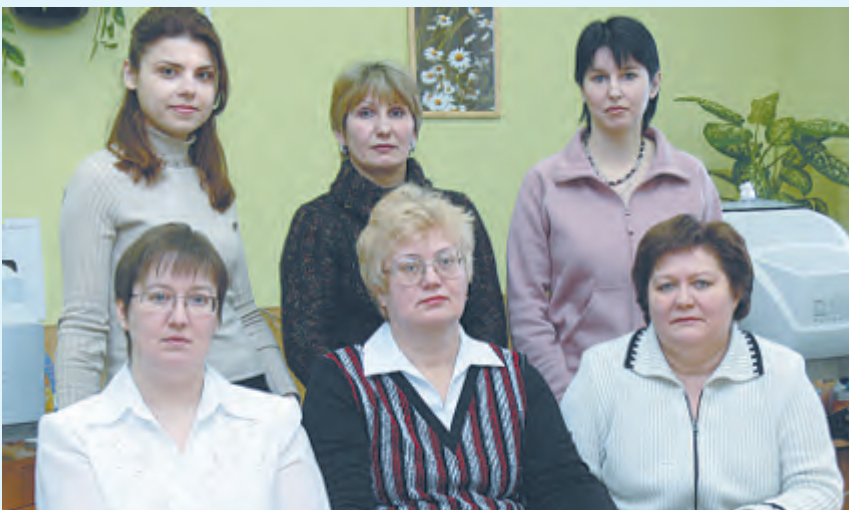
Сотрудники «Информационного центра», 2006 год

она научила меня всему. Поэтому, наверное, если бы не она, не было бы и меня. Конечно, в коллективе случается всякое. Но она умеет находить компромиссные решения аккуратно и красиво.