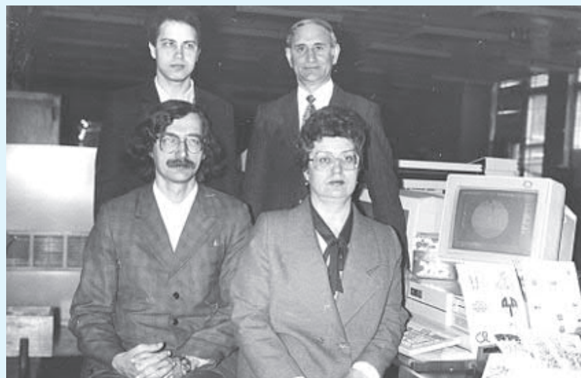
Сотрудники ЛНПО «СОЮЗ», конец 80-ых