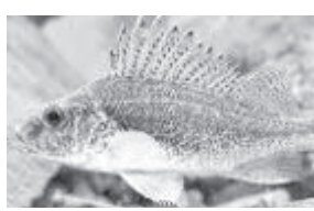
Кроссворды предоставлены сайтом www.graycell.ru