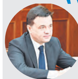
Андрей ВОРОБЬЕВ, губернатор Московской области:

В нашем городе программу проводит и ГБУСО «КЦСОР «Люберецкий», и учреждения города. В ней предусмотрены такие активности как дыхательная гимнастика; йога; компьютерная грамотность; пение; посещение бассейна; скандинавская ходьба; танцы; творчество; туристические поездки; физическая культура.