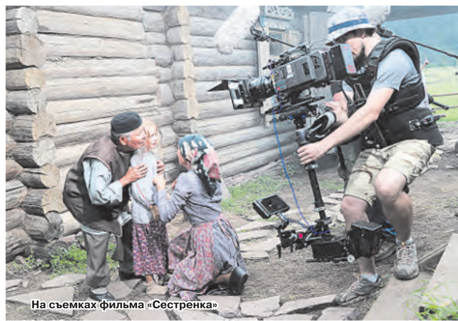
На съемках фильма «Сестренка»

Помимо дипломов победителям вручили памятные статуэтки. Их облик организаторы не меняют из года в год. Ведь, по мнению участников, кубок со звездой приносит удачу.