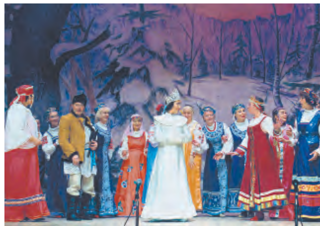
Театр «Родник». Опера «Снегурочка»