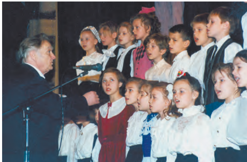
Хор в Дзержинском

Некоторых детей родители заставляли ходить в музыкальную школу. Когда другие дети играли во дворе, посещали спортивные секции, смотрели телевизор, им приходилось разучивать музы-