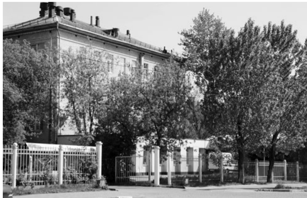
В стационаре городской больницы со следующего года начнут капитальный ремонт по программе губернатора Московской области Андрея Воробьева

Благодаря усилиям администрации города и доброй воле руководства фирмы «Фобос» у поликлиники появится филиал в новом микрорайоне. Ранее это помещение планировалось использовать под частную клинику. Министерство здравоохранения планирует выделить