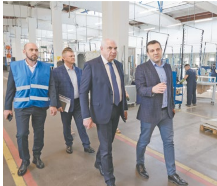
В сборочном цехе компании «Техногрупп»