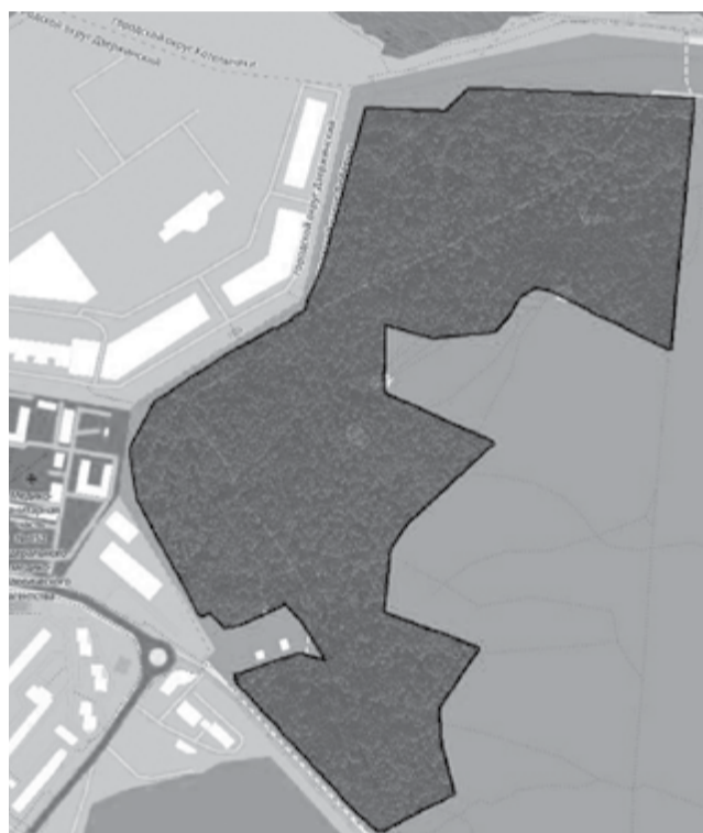
Границы территории леса, переданного в постоянное бессрочное пользование муниципалитету

В ходе благоустройства на уже сложившихся полянах сделают детскую и спортивную площадки за профилакторием «Союз».