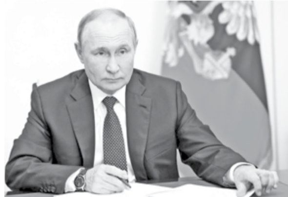
Владимир Путин.

Закон о трудовых гарантиях предусматривает приостановление действия трудового договора работника на период прохождения им военной службы. Необходимо засчитывать ее время в трудовой стаж,