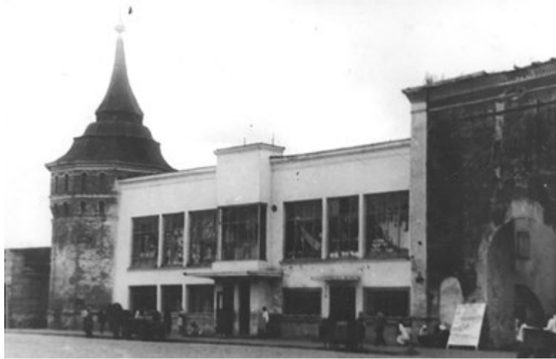
Центральный вход в школу №1 до 1956 года

Кроме общеобразовательной, коммуна имела различные отделения школ фабрично-заводского ученичества, где готовили танкистов, радистов, летчиков, парашютистов. Были театральная и художественная студии — можно было получить различные знания и развить множество способностей.