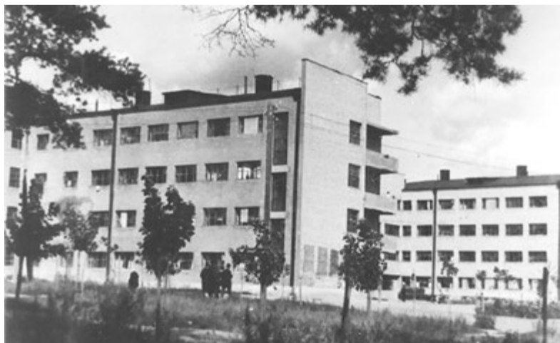
Строительство дома, где в годы войны разместилась школа №1