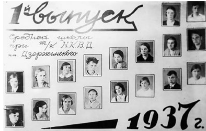
Первый выпуск школы №1