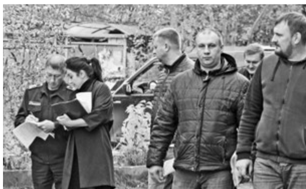
Участники смотра техники

«Дзержинский и ранее показывал неплохие результаты подготовки к зимнему периоду. Здесь вовремя заключили контракты на обслуживание техники, заблаговременно приобрели расходные материалы. В городе выстроены маршруты слежения за движением уборочной техники