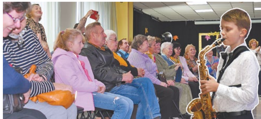
Гости праздничного концерта