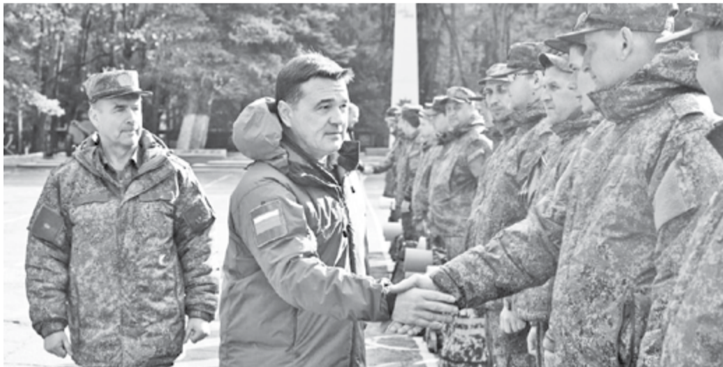
Андрей Воробьев в филиале Военной академии РВСН им. Петра Великого, где готовят мотострелков и артиллеристов

Новые меры поддержки семей бойцов, выполняющих свой долг перед страной, были приняты губернатором Московской области Андреем Воробьевым.