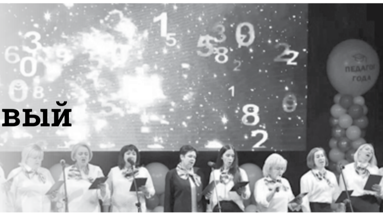
Кадры на светодиодном экране дополняют выступление хора гимназии №5

Монтаж конструкции размером 3,5 на 6 метров завершился 26 января. Первыми оценить новинку смогли гости муниципального этапа конкурса «Педагог года – 2023».