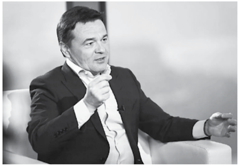
Андрей Воробьев.

По его словам, участники спецоперации должны знать, что государство заботится об их близких, пока они защищают страну. Также Воробьев призвал к поставкам на передовую всего, что может пригодиться. «Например, оснащение, дополнительная одежда и оборудование, и печки, и продукты», — перечислил губернатор Подмосковья.