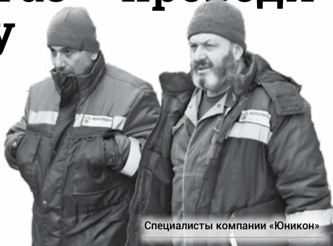
Специалисты компании «Юникон»

Горожане могут связаться с представителями компании и перенести визит сотрудников на удобное время. А если жильцы не выполняют свои обязанности и систематически срывают проведение профилактических работ,