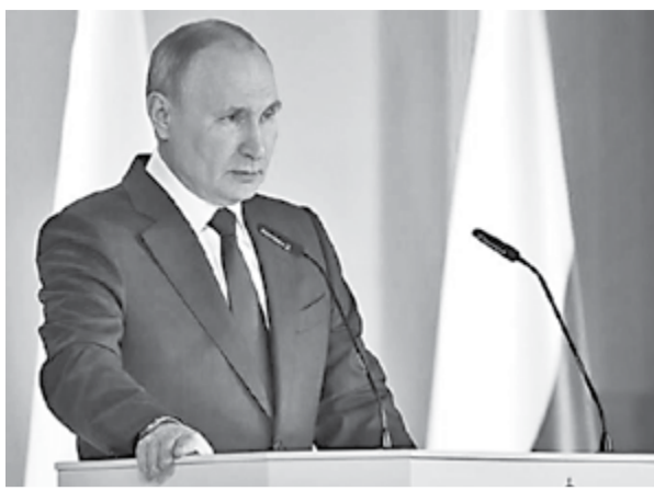
Владимир Путин.

Мысль об этом президент РФ Владимир Путин озвучил в послании Федеральному собранию 21 февраля.