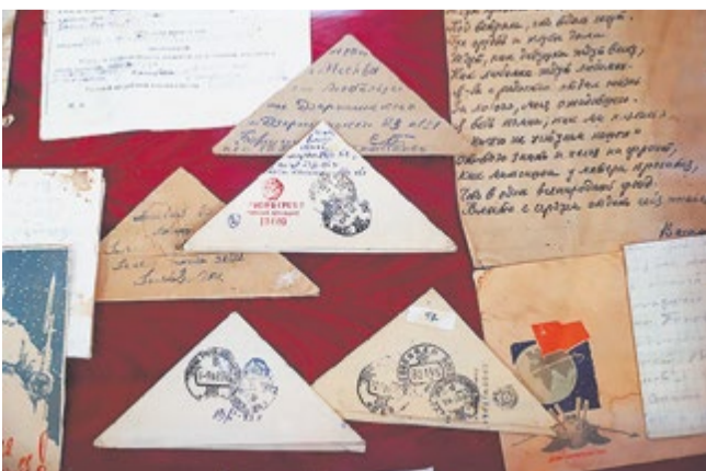
Экспозиция музея боевой славы школьного отделения №1 гимназии №4