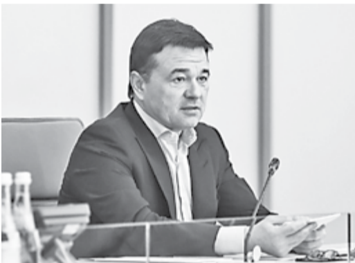
Андрей Воробьев.

«В 2022 году конкурс проходил дважды — от Московской области выиграли 10 заявок, к работам на шести объектах приступим уже этой весной. Сбор заявок на следующий конкурс — до 1 июня. Муниципальные образования должны к 1 марта определиться с территориями, до 15 мая провести обсуждение с жителями, подго-