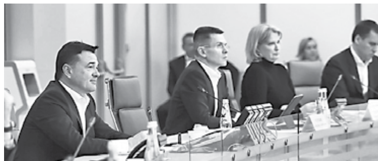
Андрей Воробьев

Центры поддержки участников СВО и их семей теперь будут работать по будням до 19 часов, а в субботу или воскресенье — не менее четырех часов. В каждом из них действует горячая линия, доступная в будни с 8 до 22, а в выходные — с 10 до 20 часов. Особое внимание — участникам СВО,