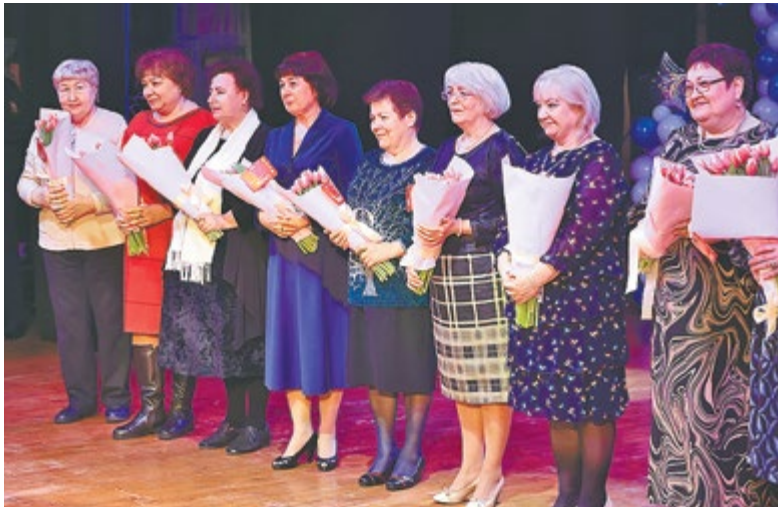
Педагоги-ветераны лицея №3