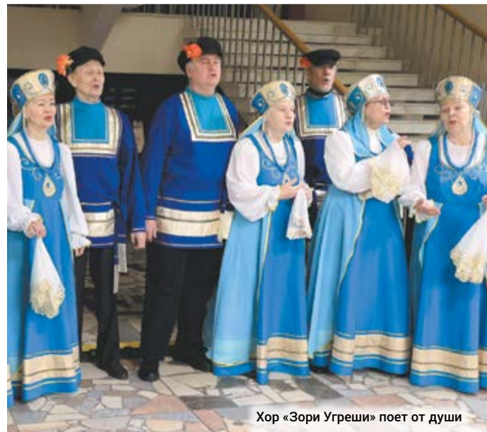
Хор «Зори Угреши» поет от души

В завершение вечера гостям показали видеобращение Елизаветы Дмитриевны Перепеченко. Ведущие озвучили вывод: выжить ленинградцам помогли вера в победу и любовь к ближнему. Сберечь мир способны доброта и милосердие, и сегодня нам нужно быть достойными памяти всех погибших.