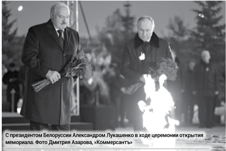
С президентом Белоруссии Александром Лукашенко в ходе церемонии открытия мемориала.

Президент России отметил, что 27 января — одна из важнейших дат нашей общей, всенародной истории. В этот день в 1944 году войска Красной армии полностью сломили блокаду Ленинграда, а год спустя, в 1945-м, освободили Аушвиц.