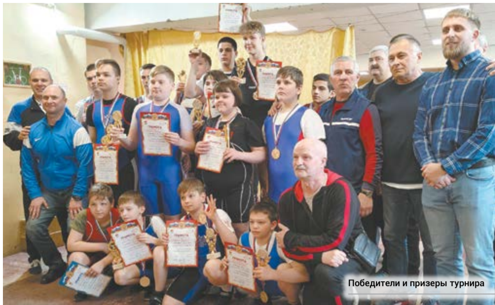
Победители и призеры турнира

Право поднять флаг России предоставили кандидату в мастера спорта, неодно-