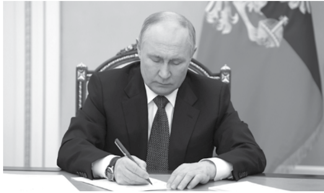
Владимир Путин

Ранее на совещании 14 марта вице-премьер и глава Минпромторга Денис Мантуров рас-