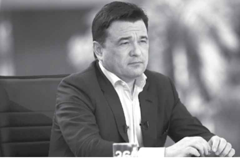
Андрей Воробьев

«Весной 2022-го наши школьники выступили с инициативой проведения акции «Доброе дело», и мы очень рады, что она приобрела такой масштаб. Сегодня в ней принимают участие не