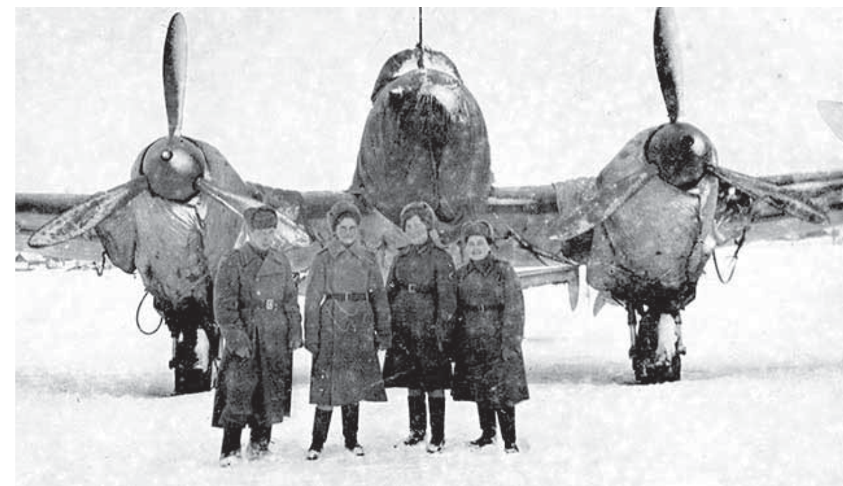
Пе-2 125-го бомбардировочного авиационного полка, как и его экипаж, морозов не боялся