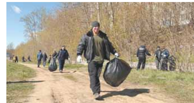
На Школьной жители убирались вместе с депутатами окружного совета и спортсменами «Орбиты»

Постепенно территория преображалась: газоны освобождались от зимнего хлама, дорожки становились чистыми, а воздух – будто свежее. Люди расходились с улыбками, благодарили друг друга, договаривались встретиться на следующем субботнике и с гордостью оглядывались на сделанное.