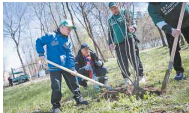
Работа кипит: папы соревнуются с сыновьями

Работа кипела без пауз: бабушки командовали внуками, папы соревновались с сыновьями, мамы организовывали, куда складывать мешки, чтобы их быстрее забрали, а подроски, вооружившись перчатками, вычищали канавы от бутылок и пакетов.