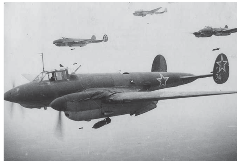
«Пешки» успешно отбомбились по немецким самолётам